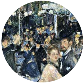
12 • Auguste Renoir