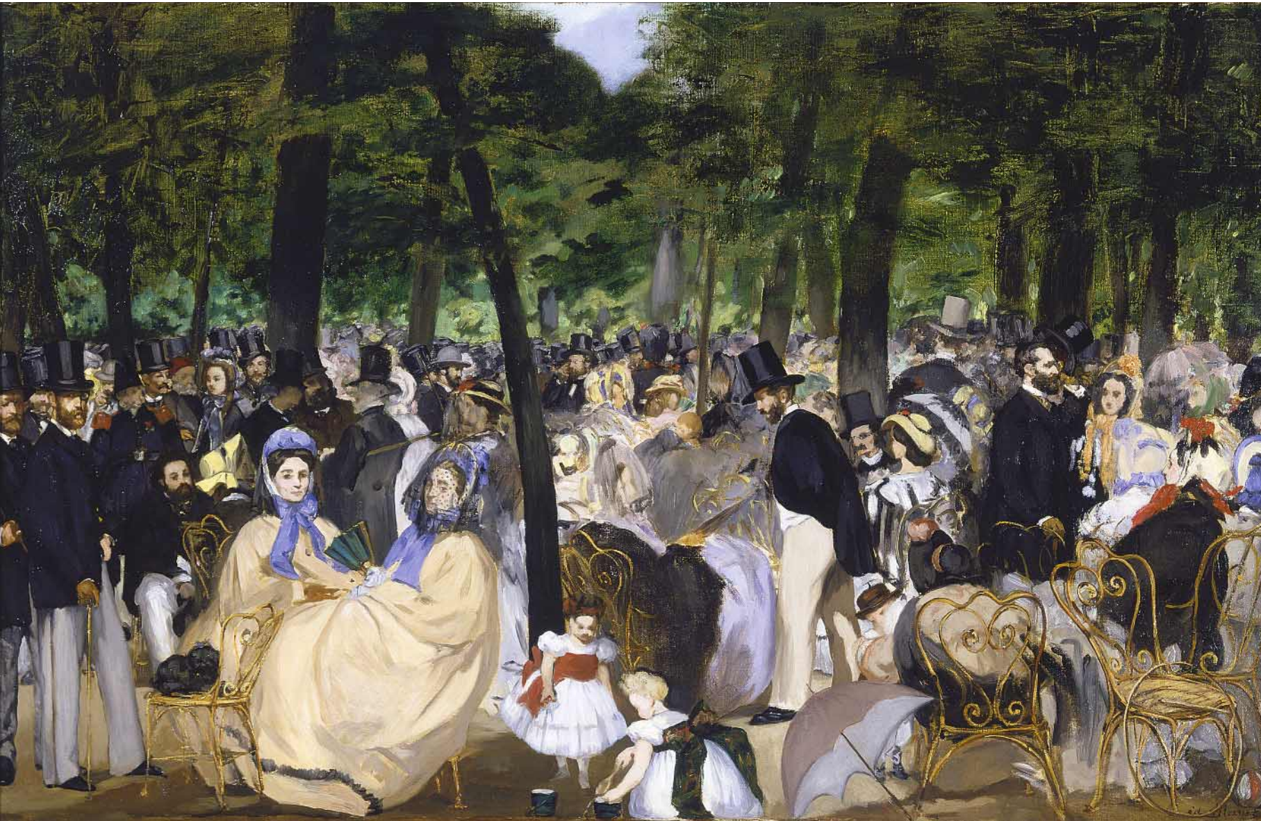
Édouard Manet, Musik in den Tuileries, 1862, National Gallery, London

Auf diesem Gemälde sind viele Freunde Manets zu sehen, zum Beispiel der berühmte Komponist Jacques Offenbach. Manet selbst ist ganz links am Bildrand.