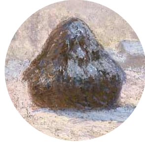
8 • Claude Monet