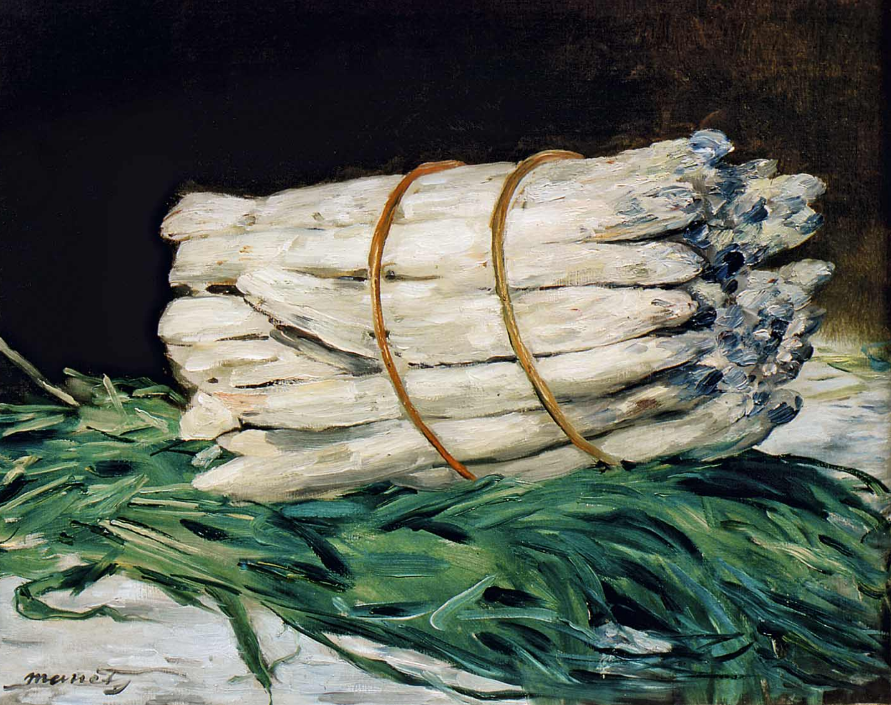
Édouard Manet, Spargelbund , 1880, Wallraf-Richartz-Museum, Köln

1880 malte Manet ein Stillleben von einem Bündel Spargel. Auch dieses Bild war nicht »ordentlich« und genau. Aber obwohl man die Pinselstriche sieht und es wirkt, als sei es schnell hingemalt, bekommt man beim Anblick dieser Spargel gleich Lust, welche zu essen.