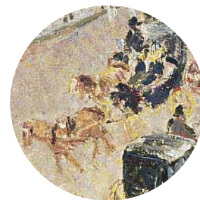
24 • Camille Pissarro