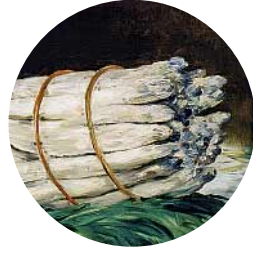
4 • Édouard Manet