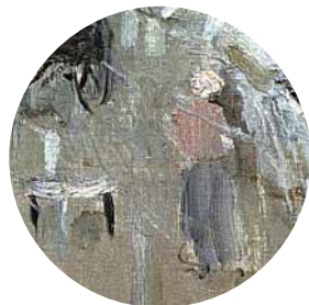
20 • Berthe Morisot