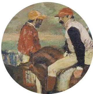
16 • Edgar Degas