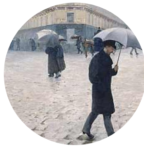
14 • Gustave Caillebotte